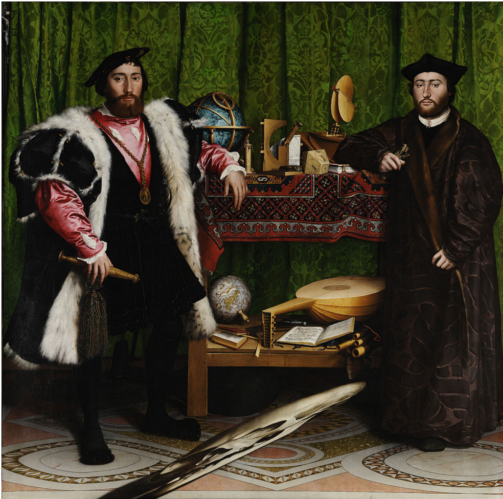
Hans Holbein, The Ambassadors (De ambassadeurs) , 1533.

You are allowed to use phone or computer-based translation for this assignment. If you do, please send the results to: ddrapak@gnspe.ca .