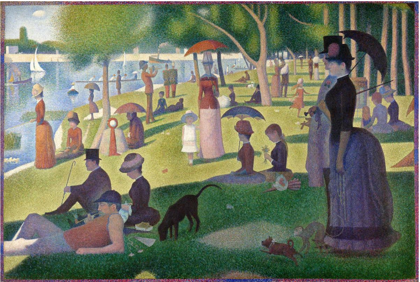
Georges-Pierre Seurat, A Sunday Afternoon on the Island of La Grande Jatte (Een zondagmiddag op het eiland La Grande Jatte) , 1884–1886.

You are allowed to use phone or computer-based translation for this assignment. If you do, please send the results to: ddrapak@gnspes.ca .